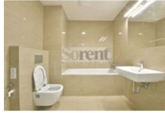
APARTMÁN 2+kk (50 m 2 - 1p 2)